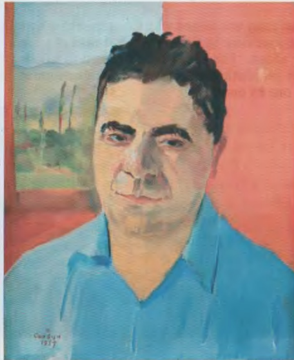
Մարտիրոս Սարյանի նկարած դիմանկարը Portret by Martiros Saryan

Analyzing his life one might conclude that he achieved all the possible scientific positions, won many medals and prizes, was elected to three dozen Academies, including five largest academies of the world, twice was granted the title of Hero of the Socialist Labour, became a National Hero of Armenia after the republic recovered its independence, always occupied very high positions on the scale of ranks.