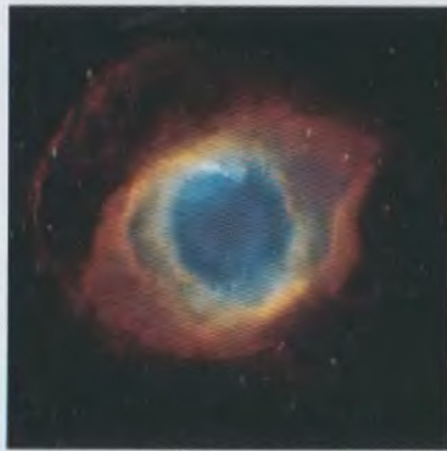
Մոլորակաձև միգամածություն Planetary nebula

5. Առաջարկել է մոլորակաձև միգամածությունների կենտրոնական աստղերի մակերևութային ջերմաստիճանների որոշման նոր եղանակ (Չանստրայի եղանակի զարգացումը) ու տվել կարճալիք ֆոտոնների վերափոխման հավանականային ձևակերպումը, որը հանգեցնում է մոլորակային միգամածությունների ճառագայթային հավասարակշռության սահմանմանը (1932 թ.):