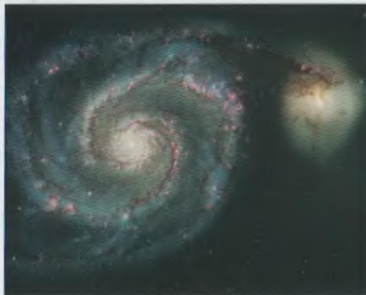
Հայտնի M51 գալակտիկան Famous Galaxy M51

The hypothesis on the activity of galactic nuclei was proclaimed. The various forms of activity were presented as different manifestations of the same phenomenon of activity. The evolutionary significance of the activity in the galactic nuclei was emphasized and a further hypothesis was suggested on the ejection of new galaxies