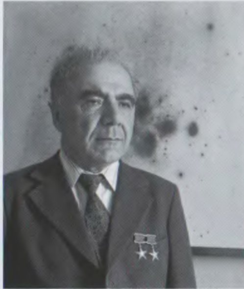
70-ական թվականների վերջին At the end of 70s