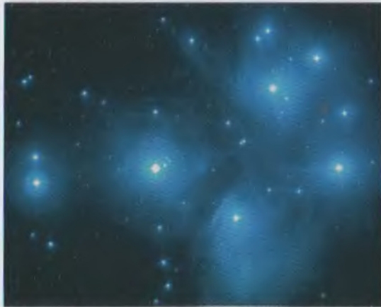
Բազումք աստղակույտը, որը գրեթե ամբողջությամբ բաղկացած է բռնկվող աստղերից The stellar cluster Pleiads. Almost all the members of this cluster are flare stars

19. Բռնկվող աստղերի վիճակագրական հետազոտությունները. առաջարկվեց աստղային համակարգում բռնկվող աստղերի ընդհանուր թվի գնահատման մեթոդ՝ հիմնված այդ համակարգում արդեն հայտնի բռնկվող աստղերի դիտումների վրա: Արդյունքում պարզվեց բռնկումային ակտիվության օրինաչափ բնույթը ցածր լուսատվության և փոքր զանգվածով ուշ դասի աստղերի համար: Ապացուցվեց, որ այդ դասի աստղերն իրենց երիտասարդության վաղ փուլերում անպայմանորեն անցնում են բռնկումային ակտիվության փուլով (1968 թ.):