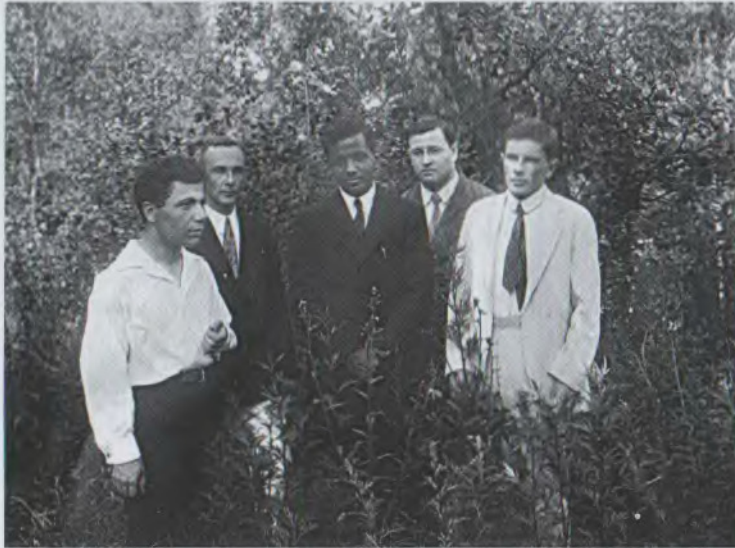
Պուլկովոյում, կենտրոնում Ս.Չանդրասեկարն է, ձախից երկրորդը՝ Ն. Կոզիրևը

1. Առաջին անգամ սեփական արժեքներին համապատասխանող դիֆերենցիալ հավասարման տեսքը գտնելու փորձ է արվել: Առաջին անգամ ձևակերպվել է Շտուրմ-Լիուվիլի խնդրին հակադարձ խնդիր, որը հետագայում դարձավ նմանատիպ հակադարձ խնդիրների հետազոտության մի ամբողջ ուղղության սկիզբ (1929 թ.):