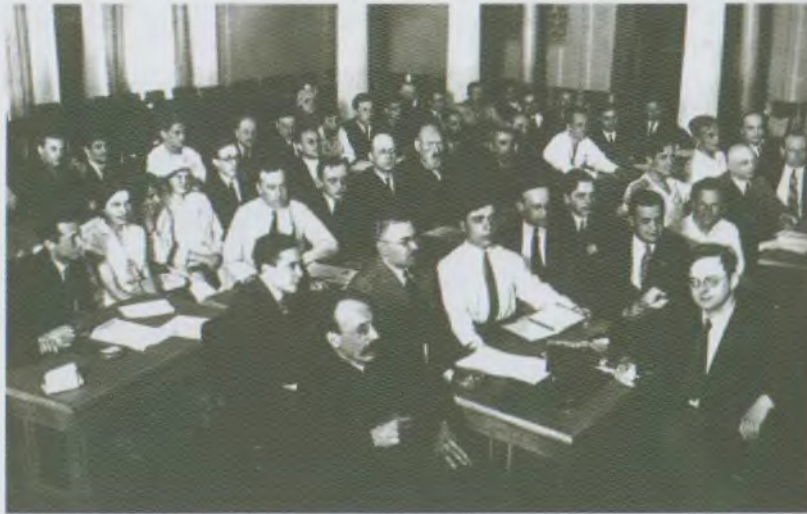
Խարկովի Ֆիզիկա-տեխնիկական ինստիտուտ, տեսական ֆիզիկայի սեմինար, 1929թ.

մասնիկները (այդ թվում հանգստի ոչ գրոյական զանգված ունեցողները) կարող են ծնվել և ոչնչանալ այլ մասնիկների հետ փոխազդեցության հետևանքով (այդ գաղափարն ընկած է տարրական մասնիկների ժամանակակից ֆիզիկայի և դաշտի քվանտային տեսության հիմքում) (Դ.Դ. Իվանենկոյի հետ համատեղ, 1930 թ.):