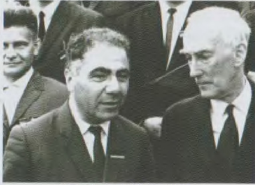
Յան Օորտի հետ, 1966թ. With Jan Oort, 1966

«Այս հարյուրամյակի աստղագետներից միայն պրոֆեսոր Յան Օորտը կարող է համեմատվել ակադեմիկոս Համբարձումյանի հետ աստղագիտության հանդեպ իր հաստատուն նվիրվածությամբ, չնայած մնացած ամեն ինչում նրանք տարբեր են իրարից: Քսանմեկերորդ դարի գիտության պատմաբանների համար արժեքավոր թեմա կլինի այդ երկու խոշոր գիտական այրերի համեմատումն ու համադրումը»: Այս խոսքերը պատկանում են Նոբելյան մրցանակակիր Սուբրամանիան Չանդրասեկարին՝ քսաներորդ դարի մեկ այլ հայտնի ֆիզիկոսին և աստղաֆիզիկոսին: