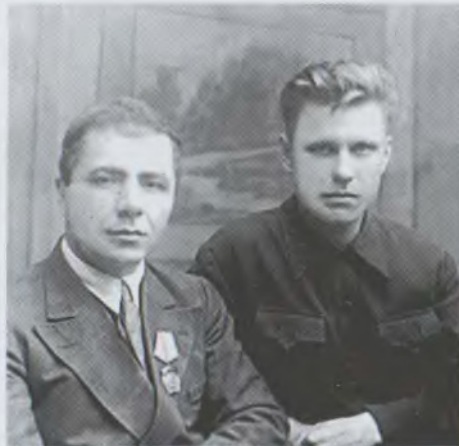
Իր աշակերտի և ընկերոջ, հետազայում ԽՍՀՄ ԳԱ ակադեմիկոս Վ. Սոբոլևի հետ With his student and friend V. Sobolev - a member of the USSR Academy of sciences

4. Առաջին անգամ հետազոտվել է կենտրոնական աստղի լույսի ձնշման ազդեցության տակ մոլորակաձև միգամածությունների լայնացման մեխանիզմը: Ցույց է տրվել, որ լույսի ձնշման հետևանքով այդ միգամածությունները լայնանում և ցրվում են տարածության մեջ և որ դրանք չեն կարող գոյատևել 100000 տարուց ավելի, եթե աստղից անընդհատ արտահոսք չկա: Առաջին անգամ ձևավորվել է տիեզերական ավելի խիտ նյութից ավելի նոսր օբյեկտների առաջացման պարադիգմը (1932 թ.):