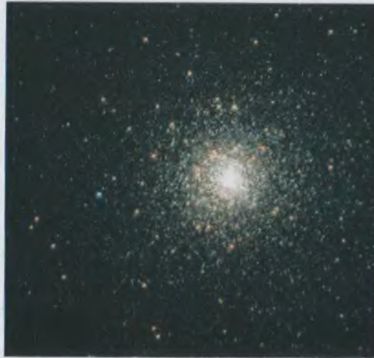
Գնդաձև աստղակույտ Globular cluster

For the first time the distribution function of stellar 3D velocities has been obtained only using radial velocities and coordinates of stars. This problem has been reduced to the numerical inversion of the Radon transform. Four decades later the same mathematical scheme was applied for the construction and exploitation of computer tomography (1936).