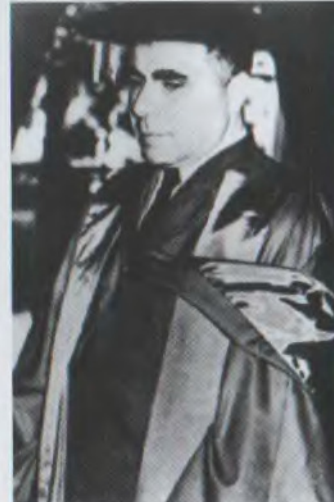
Կանբերայի համալսարանի պատվավոր դոկտոր Honorary Doctor of the Canberra university

1934 թվականին նա իր հարազատ համալսարանում հիմնադրեց Խորհրդային Միությունում առաջին աստղաֆիզիկայի ամբիոնը և դարձավ դրա վա-