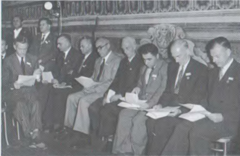
Միջազգային Աստղագիտական Միության Գործադիր Կոմիտեն Հռոմում, 1952թ.

The Executive Committee of the International Astronomical Union in Roma, 1952