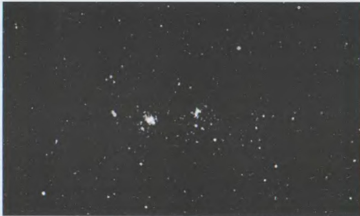
Առաջին հայտնի աստղասփյուռներից մեկը One of first known stellar associations

Discovery of stellar associations, groups of hot giants and T Tauri stars. It was shown for the first time that the star formation process continues at all stages of the evolution of our Galaxy, including the present one and that the star formation is a permanent process. A conclusion was drawn that stars are formed not individually, but in groups (1947).