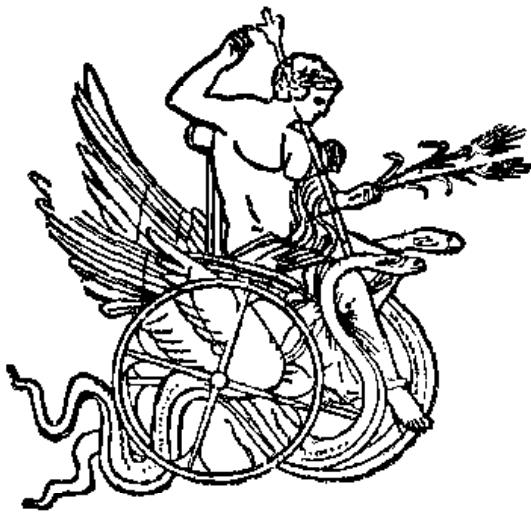
Նկ 13 Տրիպտոլեմոս:

ՏՐԻՏՈՆ , հ ու ն ., — Աֆրոդիտեի և Պոսեյդոնի դուստրը, ծովային աստվածուհի, հավերժահարս: Դիցաբանության մեջ հիշվում է, թե իբր Տրիտոնը խեցեղեն փողի հնչյուններով