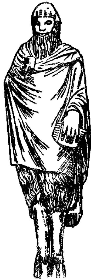
Նկ 11 Պան

Պանը օժտված էր կախարդական հմայքով, նա մարգկանց շատ անգամ ուղարկում էր ծանր մղձավանջներ: Դիցարանութիւն մեջ պատմվում է, որ Պանը սիրեց չքնաղ Սիրինքսին, սակայն վերջինս, տեսնելով նրա արտաքինը, ահարեկված փախավ: Փախուստի ժամանակ Սիրինքսը հանդիպեց մի անանցանելի գետի և որպեսզի Պանի ձեռքը չընկնի, խնդրեց գետի աստծուն ազատել իրեն, Գետի սւստվածը նրան եղեգ դարձրեց: Պանը հուսահատ կանգնեց եղեգ դարձած Սիրինքսի կողքին, կտրեց նրանից մի կտոր եղեգ ու սրինգ պատրաստեց: Այդ գործիքը անվանեց «սիրինքս» (սրինգ): Պանը հպարտանում էր իր սրնգի գեղանուշ ձայնով և, դլութված այդ գործիքի ձայնով, մրցման հրավիրեց Ապոլլոնին Վերջինս դալրացավ այդ համարձակութիւն վրա, մանավանդ երբ իմացավ, որ Սիդաս արքան գերազանցութիւնը տվել է Պանին: Ապոլլոնը քաշեց այդ արքայի ականջները և դարձրեց էշի ականջներ: Նվագի մեջ Պանը պարտութիւն կրեց Ապոլլոնից և թաքնվեց անտառի խորքում: