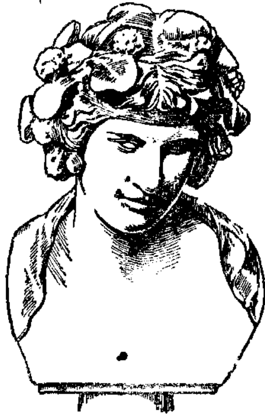
Նկ 8 Գիոնիսոս

ԴԻՐԿԵ, Հ Ո Ւ Ն ., — Լիկոսի կինը: Ըստ դիցաբանության Լիկոս արքան լքեց իր կնոջը՝ Անտիոպին, և ամուսնացավ Դիրկեի հետ: Վերջինս վախենալով, որ արքան կարող է նորից միանալ իր կնոջ հետ, խնդրեց արքային բանտարկել Անտիոպին: Բայց Անտիոպեի որդիները պաշտպանեցին իրենց մորը և սպանեցին Լիկոսին, իսկ Դիրկեին կապեցին լայրի եղան եղջյուրներից և հետո խեղդեցին մի աղբյուրի մեջ, որի անունով էլ աղբյուրը Դիրկե կոչվեց «Ներկայացան դանաչիդները, ներկայացավ Դիրկեն...», ՅՈՒՆԵՍԿՈՒՆ ԿՈՆՎԵՆՏԻ ՆԵՐՍԱՍ 621 «ԵՎ ՂՈՒՆ, և ՂՈՒՆ, ով Դիրկեի ջինջ աղբյուր...», Հոդբ., 316