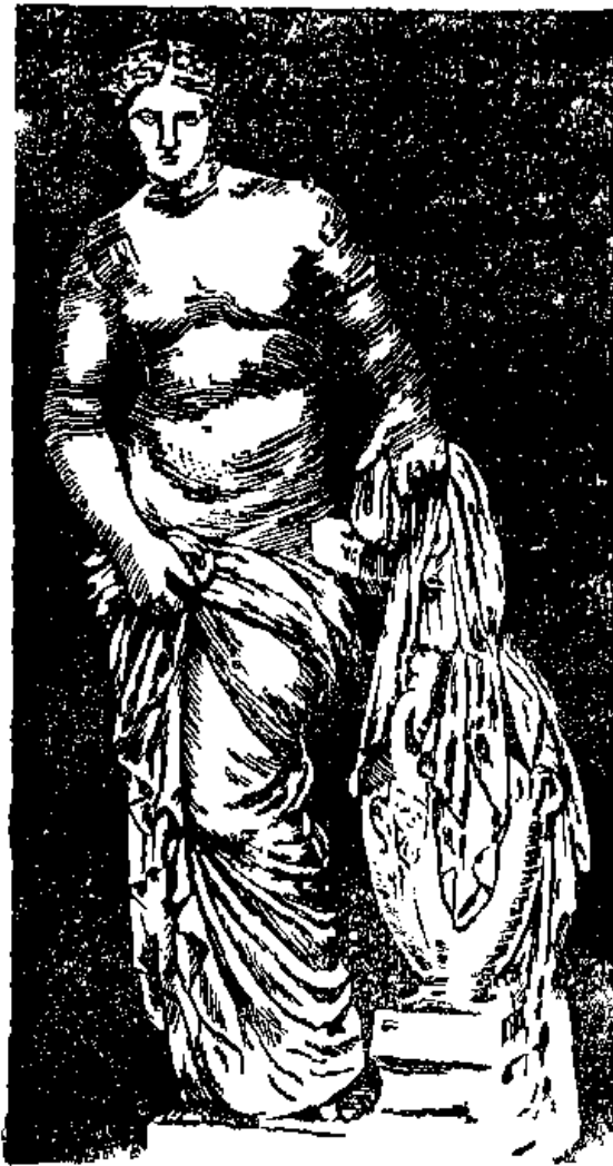
Նկ 6 Ա ի ո ղ ի ս ի

ԱՔՏԵՈՆ, հ ու ն ,— Ալտոնոլի որդին: Գիցաբանու-