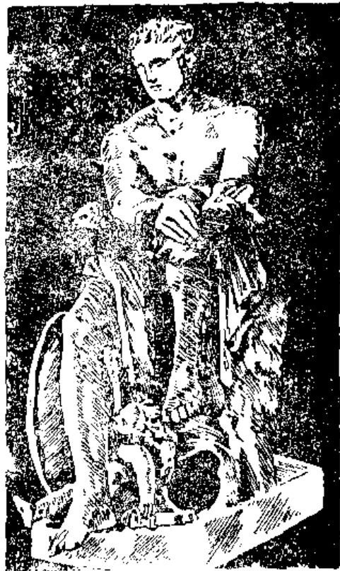
Նկ. 4 Արես:

Այսպիսով, այն բլուրը, ուր լավեց Արեսի դատավարությունը, կոչվեց Արեսի բլուր: «Այդ օրեն սկսյալ ատյանին կազմված