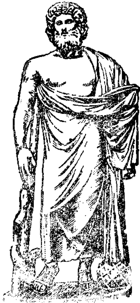
նկ 3 Կակեդոնոս:

ԱՍՓՈԴԵԼ , հ ու ն ., — Դիցաբանության մեջ հասկացվել են որպես Հադեսի աշխարհի մեջ բուսնող կակաչներ կամ սննտարածությունները, ուր բացվում են պտերը Ըստ դիցաբանության այդ տարածությունների վրա թափառում էին մեռածների սնմարմին ու թեթևասահ ստվերները: «Հադեսի թագավորության մուշկ և ասփոդել դժգույն ծաղիկներով պատած