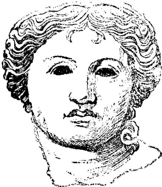
նկ 1ա Մհամելտ

ԱՆԱՀԻՏ, ս ի ս , — Ստավաժուհի, Արամազդի դուստրը, Ապոլլոնի բույրը Դիցարանության մեջ ճանաչվել է որպես