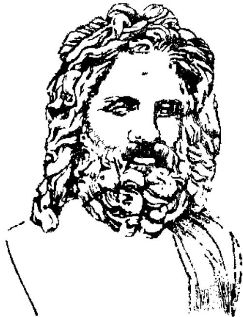
64 Յ Զևս

ԶԵՎՍ, Հ Ո Ւ Ն ., — Քրոնոսի և Հուեայի կրտսեր որդին, օլիմպիական աստվածներից վեհագույնը: Նրա ձեռքին էր մարդկանց նահատապիրը, և նա էր, ըստ դիցարանության, կանխագուշակում նրանց սպագան: Քրոնոսը վստահ չէր, որ իր իշխանությունը միշտ կմնա իր ձեռքում: Նա երկյուղ ուներ իր որդիներից, կարծում էր կապտամբեն իր դեմ և իրեն կդատապարտեն նույն նահատապրին, որին ինքը արժանացրել էր Ռերանոսին: Այս պատճառով կնոջը՝ Հուեային հրամայեց իր մոտ բերել նորածին էրեխաներին: Քրոնոսը անգթորեն կուլ տվեց նրանց Հուեան շուգեց իր վերջին որդուն էլ կործանել, դնաց կրետե կղզին և մի խորունկ անձավում ծնեց Զևսին: Բարուրի մեջ որդու փոխարեն մի երկար քար դրեց և տվեց Քրոնոսին: Վերջինս, շկասկածելով կնոջ հավատարմությանը, կուլ տվեց «բարուրը» Զևսը մեծանում էր Կրետե կղզում: Ադրաստեան և Բղևան նրան կերակրում էին Ամալփեա ալժի կաթով: Մնձավի մոտ հրսկում էին պատանի կուրետները: «Զևսի վեհուններն այ կը կոչվեին Զևսի թեմիտներ», Մ Ռ., 246 «Աղաչում է Զևսին ձեռները մեկնած», Հ Հովե., հ 1, 212: