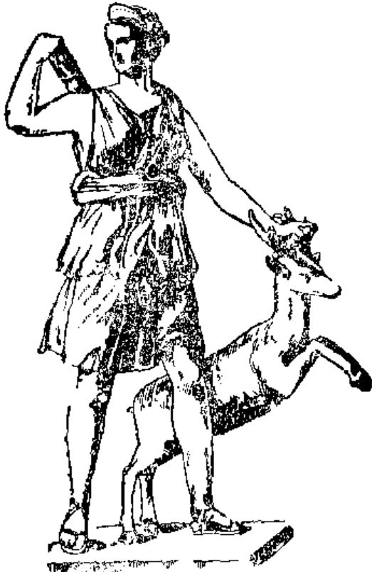
Նկ. 5 Արտէիս

«Եվ Արեսն իր նվերներով սլզծեց մահիճն այն կաղչիկի, Այնժամ Արփին ավետաբեր՝ գնաց հարտնեց Հեփեստոսին», ՀՈ , 105