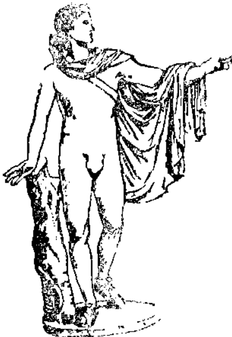
Նկ 2 Սպուլոն:

ԱՌՆԵՈՍ, հ ու ն . — Ըստ առասպելի ապրում էր Իթա- կեոսւմ և հատնի էր որպես անկուշտ մուրացիկ: Երբ Ողիսևսը ծպտյալ, որպես մուրացիկ, շրջում էր իր տան շուրջը և բաժին խնդրում Պենելոպեի սեղեբիների (տարփածունների) ճոխ սե-