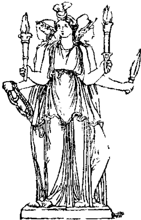
Դկ 10 Հեկտոր

ՀԵՂԻՆԵ, հ ու լ ն ., — Մենելայոսի կինը, Զևսի և Լեդայի դուստրը։ Ըստ դիցաբանության բոլոր կանանցից գեղեցկագույնն էր։ Դիցաբանության