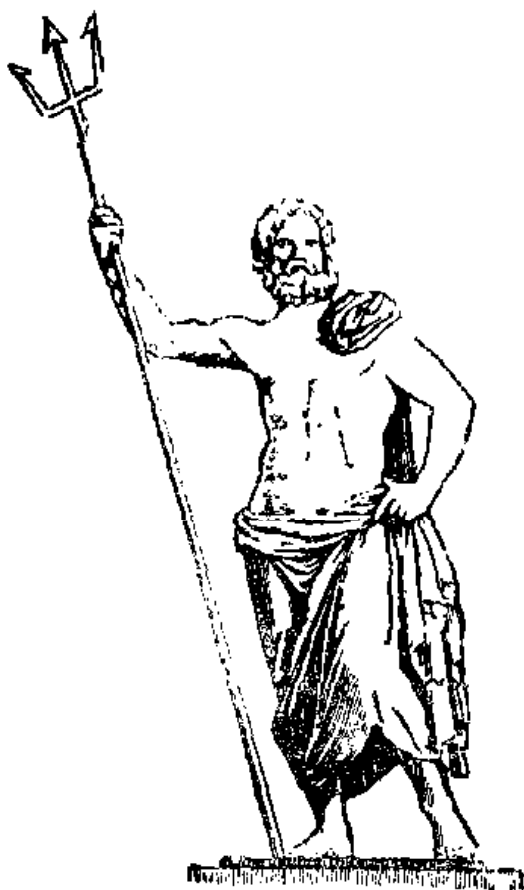
Նկ 12 Պոսեյդոն:

մոտ էր նաև ծերունի Պրոտեոսը, որ ծովի նման գոհուում էր յուր դեմքը և ցանկալի կենդանու կերպարանք ստանում: Նրան էր ծառայում նաև իր դեղանի որդին՝ Տիտոնը, որ իր խեցեղեն փողի հնչյուններով ահեղ փոթորիկներ էր առաջ բերում: «Քեզմե, ո՛վ վեհ Պոսեյդոն, Մովն է թափուր», Դ. Վ., 228: