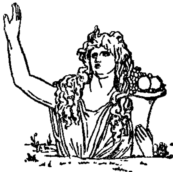
Նկ 7 Գևա:

ԳԵՐԻՈՍ , հ ու լ ն ,— Հրեշավոր հսկա: Քրիստոսի և օվկիանուհի Կալիբրոնի որդին: Ըստ իրցաբանութեան ունեւր երեք մարմին էրեք գլուխ, վեց ձեռք, վեց ստք: Հերակլեսը Գերիոնից խլեց նրա ողջ նախիրը և նվիրաբերեց Լիբիաթեսին: «Գերիոն մի հրեշավոր հսկա էր», Կուև, 212.