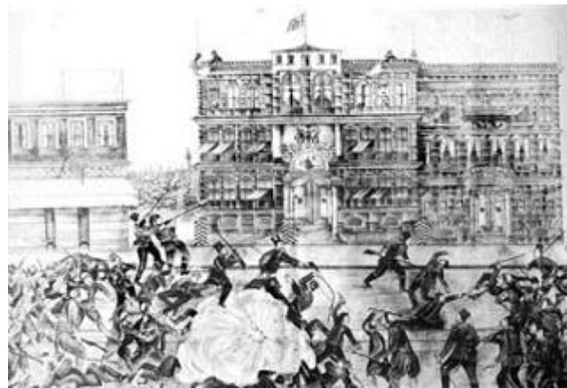
Պանք Օթոմանի գրաւումը (գծանկար)

1894-էն 96 հայաբնակ նահանգներու մէջ մօտաւորապէս 200,000 հայ կը ջարդուի, 100,000 կը մահմետականացուի, 100,000 կին ու աղջիկ կ'առեւանգուի եւ թուրքերու հարեմները կը տարուի: 100,000 հայ Կովկաս, 60,000 Եւրոպա եւ Ամերիկա, 12,000 ալ Պուլկարիա կը գաղթէ: