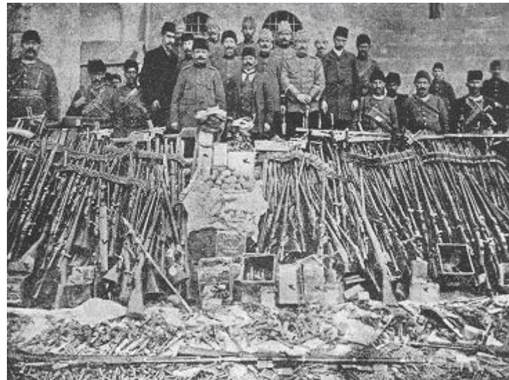
Հայոց տուներու «խուզարկութիւն»ներու ընթացքին «գտնուած» զէնքեր: Նման նկարներ կը գործածուին ցոյց տալու, թէ հայեր ապստամբութեան կը պատրաստուէին:

1915-ի Փետրուարին տրուած հրամանով կը հաւաքուի հայ զինուորներուն զէնքերը, անոնցմով կը կազմուին ծանր աշխատանքի ջոկատներ (ամելէ թապուրու): Անոնք, զանազան վայրեր իրենց տրուած գործերը կատարելէ ու իրենց գերեզմանները փորելէ յետոյ, կը գնդակահարուին: