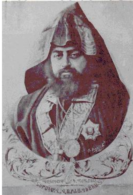
Ներսէս Վարժապետեան Պատրիարք