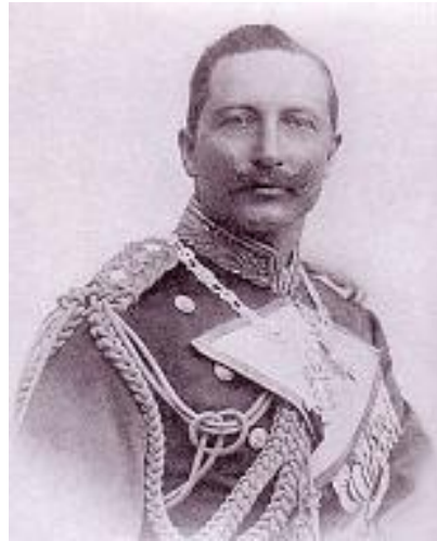
Գերմանիոյ Վիլհելմ Բ. Կայսր

Երբ Գերմանիոյ Վիլհելմ Բ. կայսրը 1889-ի Նոյեմբերին Պոլիս կայցելէ, հայեր առիթէն օգտուելով, աղերսագրով մը իրեն կը յիշեցնեն, թէ Պեռլինի Վեհաժողովի 61-րդ յօդուածը ցարդ գործադրութեան դրուած չէ: Հայերու այս արարքը Սուլթան Համիտին զայրոյթ կը պատճառէ: «Հայկական Հարց»-ը լուծելու գաղափարը իր մէջ բոլորովին կ'արմատանայ: