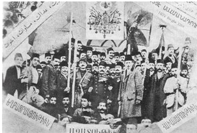
Սահմանադրութեան հռչակման առթիւ Խարբերդի մէջ պատրաստուած նկար

Ապտիւլհամիտ հայերը տնտեսապէս ալ տկարացնելու նպատակով յատուկ օրէնքներ կիրարկել կուտայ եւ զանոնք խիստ հսկողութեան ու քննութեան կենթարկել: