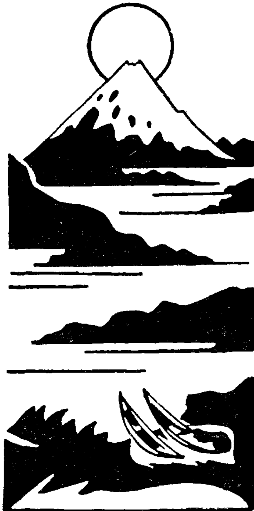
7 Ծառը նսկած պեղիս